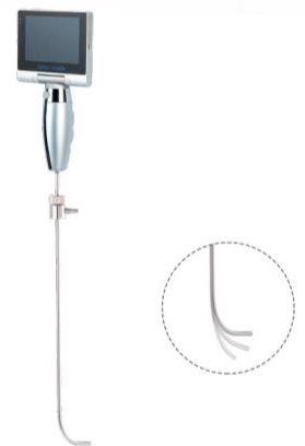
S-RVL Video Stylet