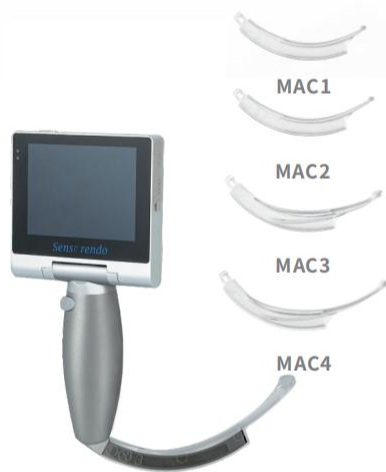
S-VL-01 Video Laryngoscope with Disposable Blades